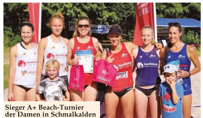
Sieger A+ Beach-Turnier der Damen in Schmalkalden

Künkelsgasse 30, Schmalkalden Norbert Gelke, Tel.: 0151 / 20300052