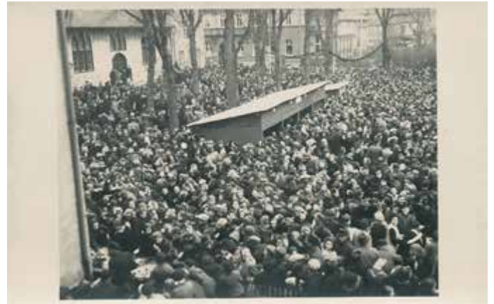
ERSTER „FREIER MARKT“ NACH DEM KRIEG IN SCHMALKALDEN. OEAG-046

Eröffnung des ersten Freien Marktes in Schmalkalden auf dem Schulhof der ehemaligen Realschule, Weidebrunner Gasse 27 (heute Nr. 19). Erstmals nach dem Krieg durften die SchmalkalderInnen wieder ohne Lebensmittelmarken einkaufen.