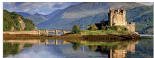
Eilean Donan Burg in Schottland

Freitag, 01. November 2019 um 19.30 Uhr Mehrzweckhalle in Schmalkalden