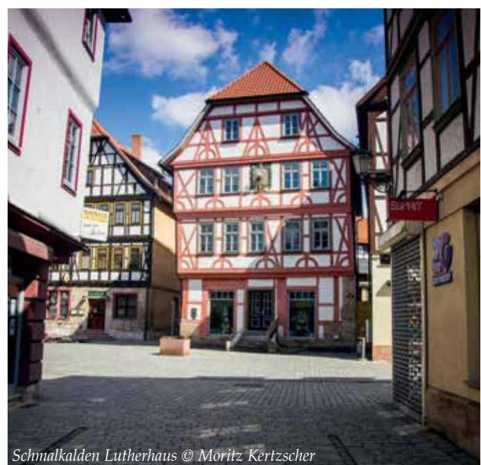
Schmalkalden Lutherhaus