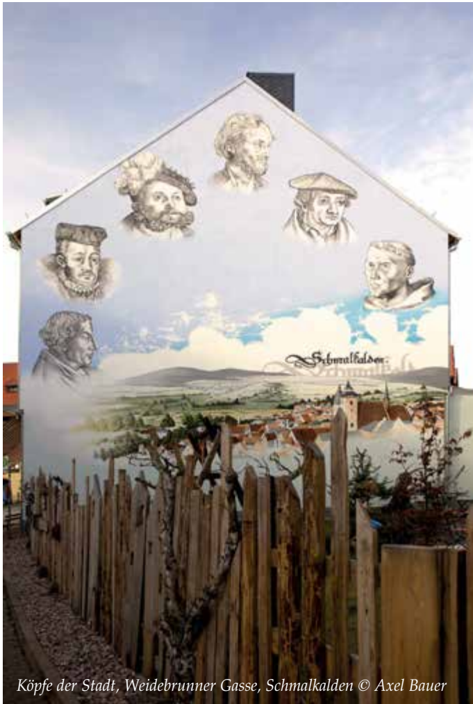
Köpfe der Stadt, Weidebrunner Gasse, Schmalkalden