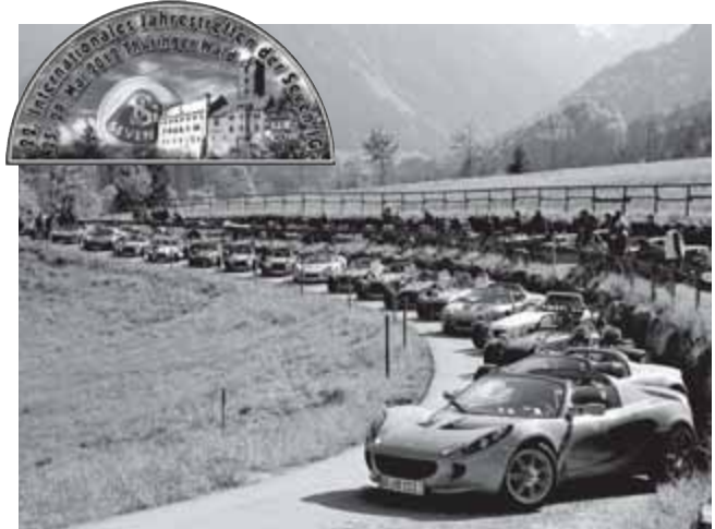
Am Pfingstsonntag erwarten wir am Nachmittag ca. 130 dieser englischen Sportwagen in der Schmalkaldener Altstadt.

Die Seven-Interessengemeinschaft wurde 1989 gegründet und betreut Fahrzeuge der Marke Lotus und deren reichhaltige Nachbauten. 2000 Mitglieder aus 11 Ländern werden zum Treffen im Thüringer Wald erwartet.