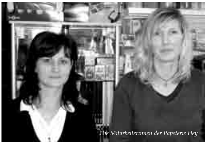
Die Mitarbeiterinnen der Papeterie Hey