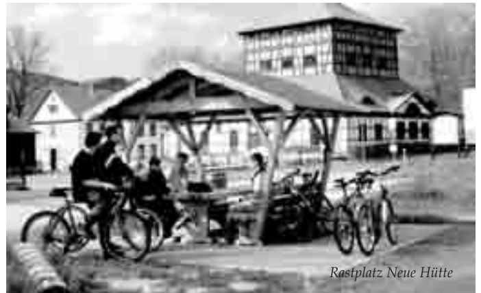
Rastplatz Neue Hütte

14.06.2009 | Stadtgebiet und Hochofenmuseum Neue Hütte Schmalkalder Radlersonntag 10.00 Uhr Radlertagsgottesdienst Stadtkirche St. Georg, 11.30 Uhr Start zur Radtour über autofreie Straßen mit Bergwertung in Struth, Erlebnistour in Seligenthal und 14.00 Uhr Infos rund ums Rad, Preisverleihung, Musik, Speis´ und Trank an der Neuen Hütte. Startgebühr: 2,00 EUR, ADFC-Stand am Altmarkt (Kinder in Begleitung der Eltern frei)