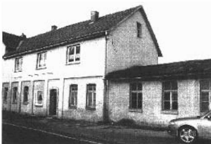
Südansicht des Wohnhauses mit angrenzendem desolatem Nebengebäude